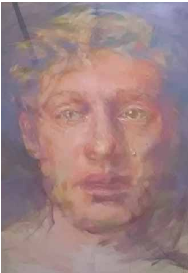
Χρήστος Λάσκαρης (Λάρισα) Έργο “Crying shame” , 2019, ακρυλικά σε καμβά, 200 x 200 εκ.

Ντροπή, ένα επώδυνο συναίσθημα το οποίο προκαλείται όταν δεν μπορούμε να διατηρήσουμε μία ιδανική κατάσταση. Ένα δυνατό συναίσθημα το οποίο όλοι μας αισθανόμαστε αλλά προτιμούμε να το αγνοούμε. Παρ' όλες τις πολιτισμικές διαφο-